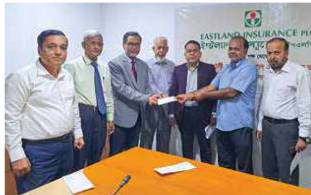
Cheque of financial assistance handed over to one of the victims of Feni's flood, 2024

Appropriate accounting policies were applied in preparation of the financial statements.