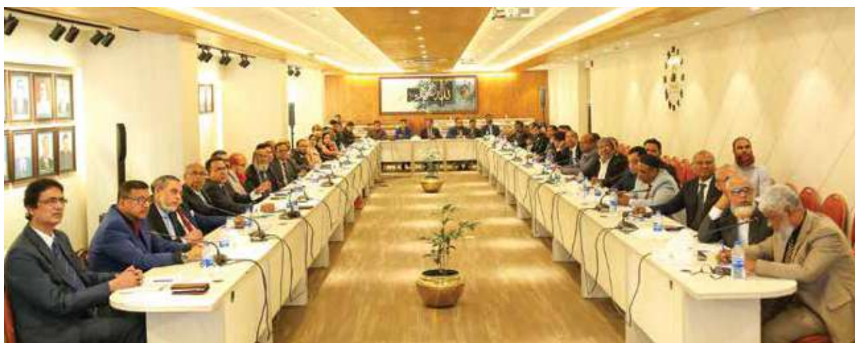
Partial View of the participants of the Annual Branch Manager's Conference

Notice relating to the election of Directors from Public Subscribers has already been published on April 29, 2025 in 02(two) National Dailies. Being eligible the above mentioned 02 nos. Directors submitted their nomination to the company for re-election/ re-appointment. As no other candidate except the above mentioned candidates applied for, the Board of Directors recommended the