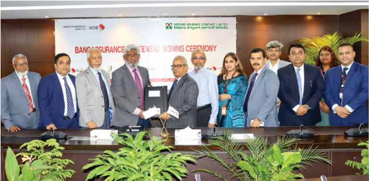
Eastland Insurance signed Bancassurance agreement with the United Commercial Bank (UCB)

বীমা খাত টুংকির সাথে সম্পৃক্ত। আমাদের ব্যবসা প্রায়শই টুংকি ও অনিশ্চয়তার কারণে প্রভাবিত হয়। আমরা নির্ভরযোগ্য টুংকি ও গ্রাহকের বীমা কভারেজ নিশ্চিত করি।