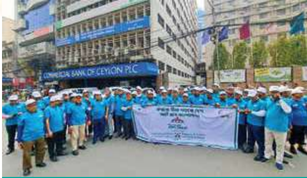
Eastland Insurance observed 'Insurance Day' on March 01, 2024

experiences ever. After taking charge by the new Government in August, main challenge was to re-establish the financial stability and law and order situation of the country. Gradually situation has changed at the end of the year with the support of IMF supported loan, foreign aid, higher amount of remittance and sharp growth of export.